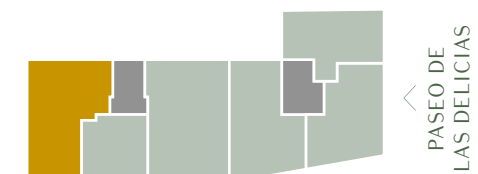
C/ PALOS DE LA FRONTERA