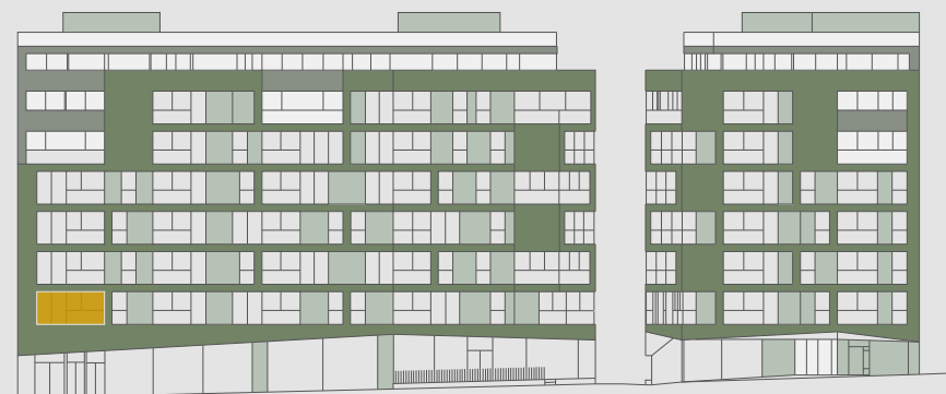
C/ PALOS DE LA FRONTERA